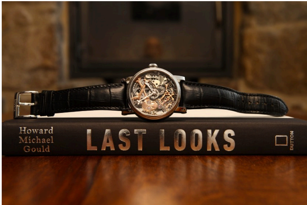
Real Skeleton auf der Buchvorlage zum Film Last Looks

So kam es also, dass unsere „Real Skeleton“ sich im Sommer 2019 auf den Weg nach Atlanta USA machte, wo der Film vor Hollywood-Kulisse gedreht wurde. Natürlich mussten wir im Vorfeld Dokumente unterzeichnen, die strikte Geheimhaltung des Projektes vereinbarten. Wir hatten also eine Uhr in einem Film und durften nicht darüber sprechen. Das war hart.