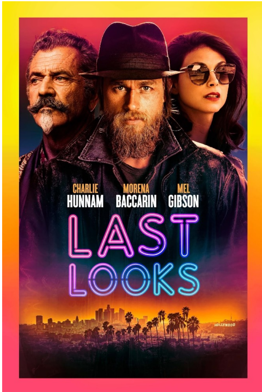
Offizielles Filmposter

Wie auch bei vielen anderen Filmproduktionen wurde das Veröffentlichungsdatum immer wieder verschoben in der Hoffnung, dass irgendwann wieder Normalität eintritt. Anfang Februar 2022 war es dann soweit und „Last Looks“ wurde offiziell in den USA veröffentlicht.